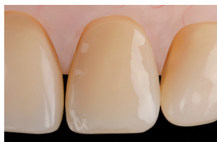
Risultato finale con OptraSculpt Pad

I pad anti-appiccicosità di OptraSculpt Pad consentono di adattare e modellare i compositi con facilità, senza lasciare indesiderate tracce sul restauro. Con assoluta efficienza e rapidità si realizzano restauri dalle superfici omogenee e levigate.