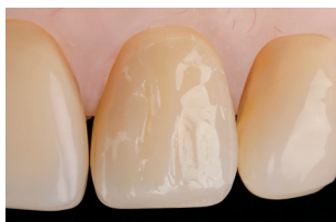
Risultato finale con spatola in metallo