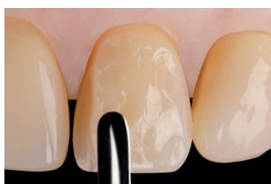
Modellazione con spatola in metallo