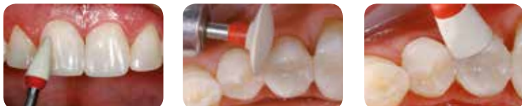
Fotografías: Dr M. Dieter, Ivoclar Vivadent, Schaan and Dres. A. Peschke and L. Enggist, Ivoclar Vivadent, Schaan

OptraPol® es un sistema de pulido en un solo paso con relleno de cristales de diamante microfinos (contenido del relleno: hasta 72 % P/P). Los resultados son visibles en tan solo unos segundos. OptraPol consigue restauraciones de composite altamente estéticas con una luminosidad natural. En un solo paso las restauraciones se alisan consiguiendo un alto brillo.