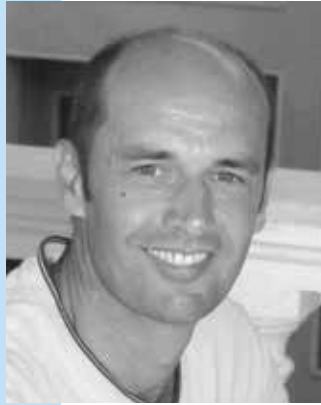
ZT Yves Gastard Pôle d'Odontologie et de Chirurgie Buccale du CHU Rennes, Frankreich