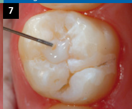
Applizieren des Versieglers