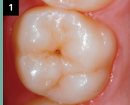
Zu versiegelnder Zahn